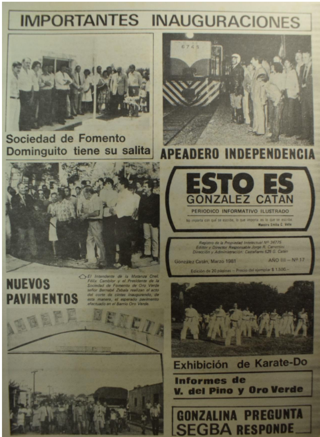
Figura 4. Número 17, marzo de 1981.

“Importantes inauguraciones”. La información sobre los avances en la obra pública fue uno de los aspectos destacados del medio. Aquí el “Apeadero Independencia” y nuevos pavimentos, entre otros.