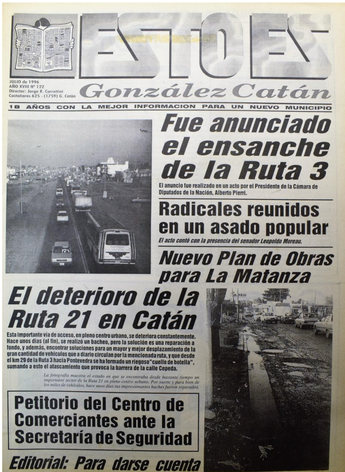
Figura 11. Número 122, julio de 1996.

Esto Es informa sobre el ensanche de la Ruta Nacional Número 3, que recién se concretaría diez años después.