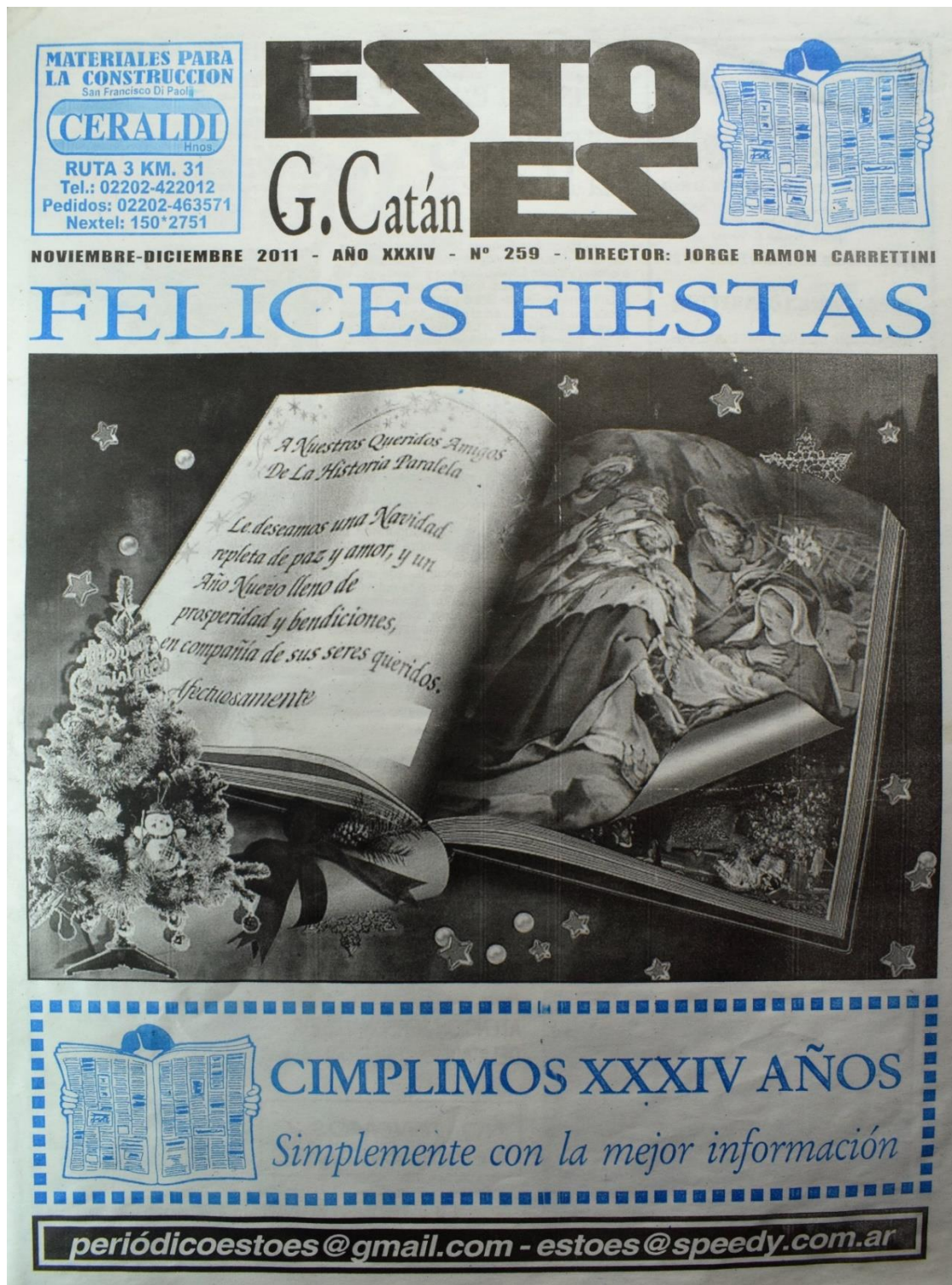
Figura 17. Número 259, noviembre-diciembre de 2011.

Última aparición: 34 años, contados desde el número promocional; o bien 32, desde su lanzamiento formal. El mayor hito del periodismo escrito local.