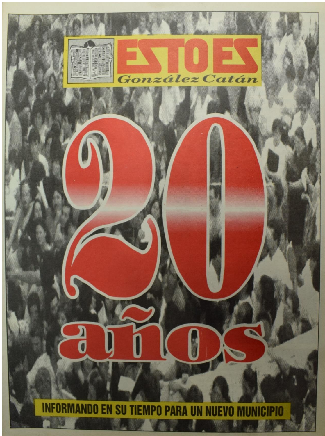
Figura 12. Número 135, octubre de 1997.

El número da cuenta de veinte años de ardua tarea, desde aquel “número cero promocional” que precedió al primer número publicado en 1979.