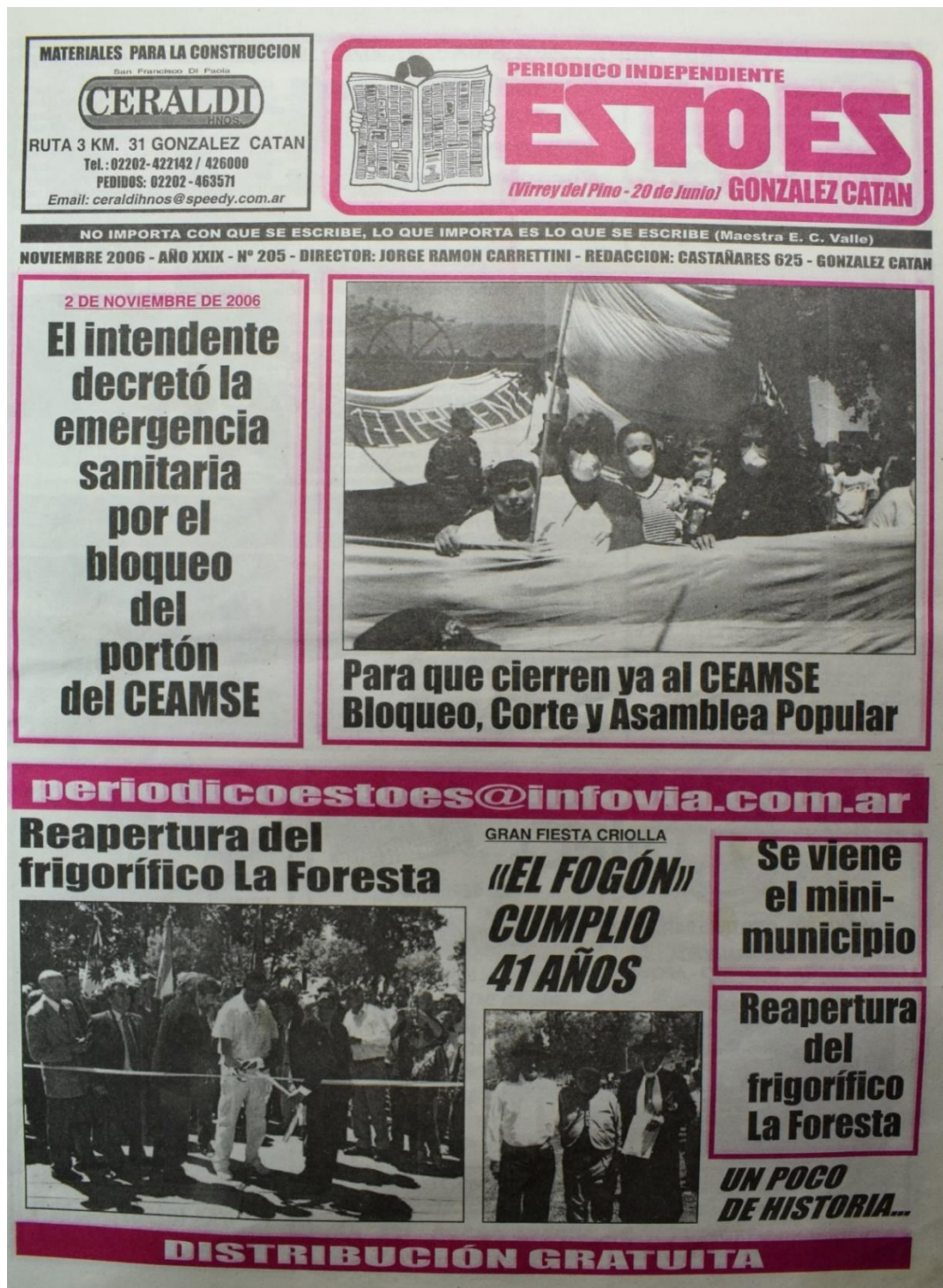
Figura 13. Número 205, noviembre de 2006.

Lejos de aquel prometido “cinturón ecológico”, el basural se multiplicó y creó un grave problema ambiental. Los “vecinos autoconvocados” lo denunciaron activamente. Aquí, masivo bloqueo al ingreso de la Ceamse, hoy recordado como El Catanazo.