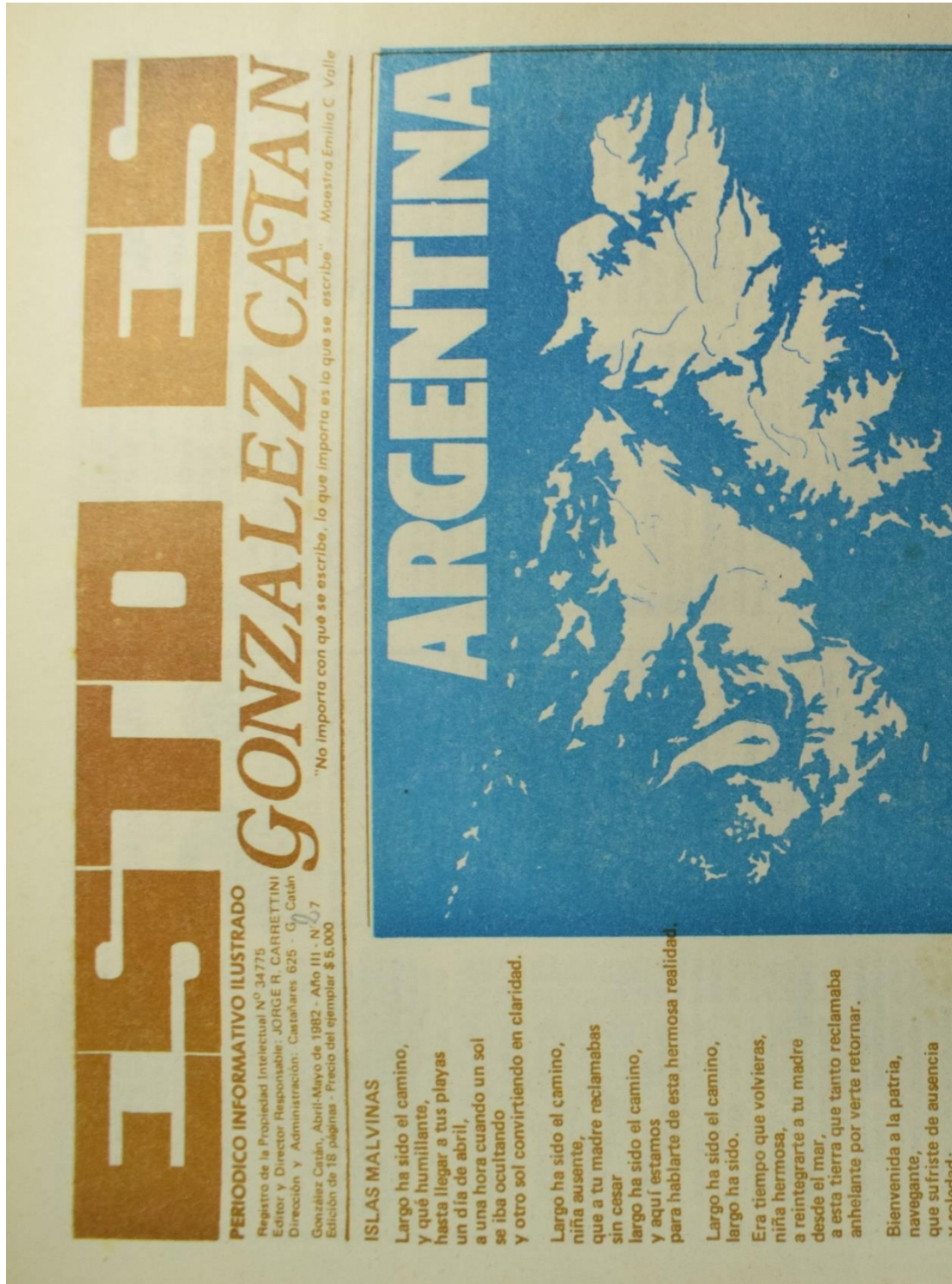
Figura 5. Número 27, abril-mayo de 1982.

Los acontecimientos nacionales más relevantes tampoco faltaron en las páginas de Esto Es : aquí, Malvinas. En las ediciones siguientes se cubriría el homenaje al soldado Julio Rubén Cao, maestro de la Escuela 95 caído en las islas.