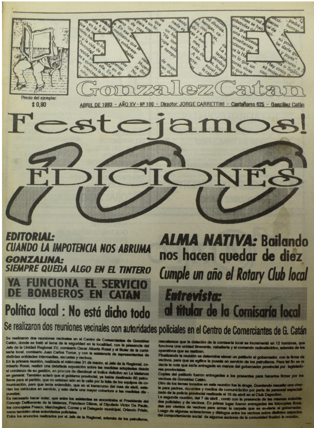
Figura 9. Número 100, abril de 1993.