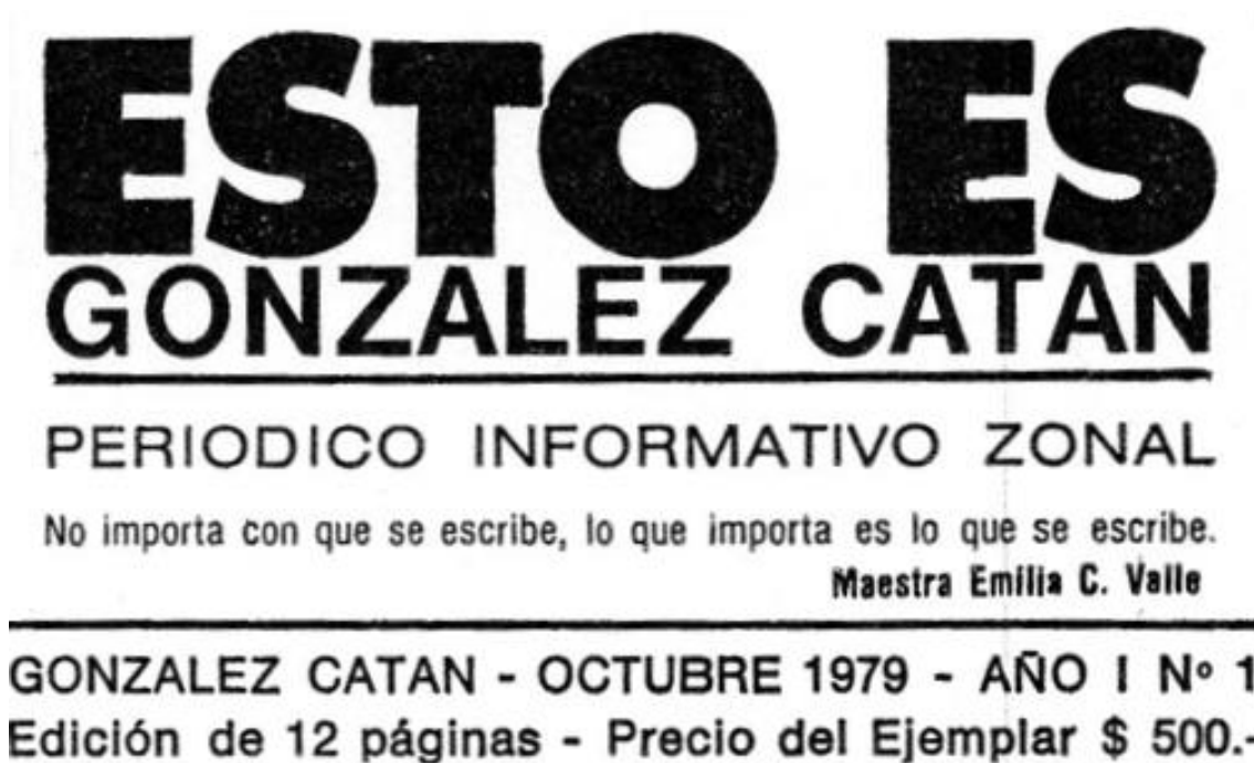
Figura 2. Detalle de la portada del primer número.

Las problemáticas típicas de la postmodernidad se venían intensificando, y la crisis del 2001 las agravó. En sus últimos años, la publicación no dejó de analizarlas, pero la sociedad local se tornaba más compleja y el contexto se revelaba cada vez menos propicio para la rutina diaria de nuestro periodista. Alcanzó a dar cuenta de obras y eventos importantes para la zona (el ensanche de las rutas, el centenario de la localidad, la inauguración de la Región Descentralizada Sur), hasta que finalmente dejó de aparecer en 2011, cuando ostentaba el título de decano del periodismo escrito en el Partido de La Matanza.