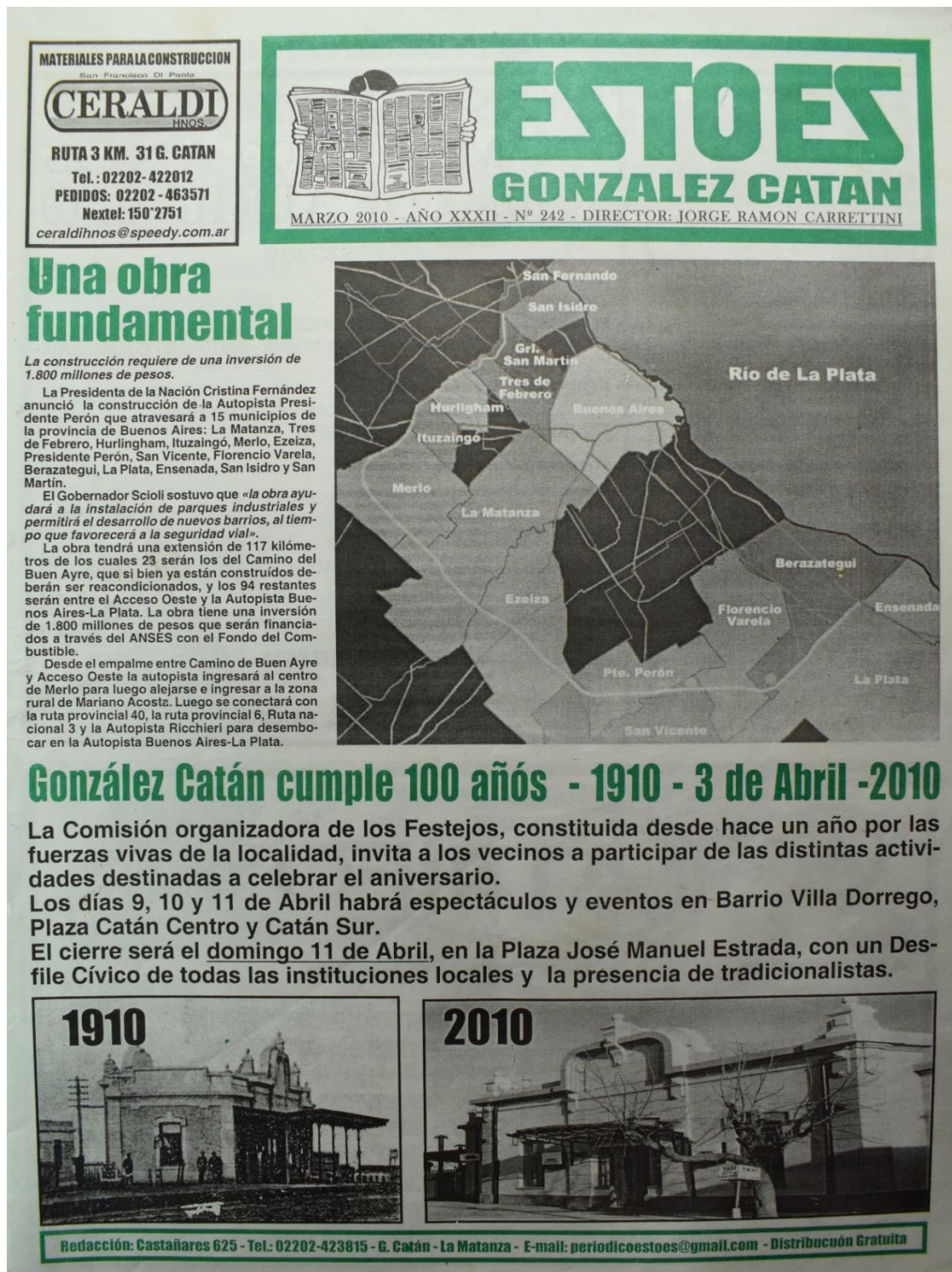
Figura 16. Número 242, marzo de 2010.

En vísperas del centenario de la localidad se publican en portada las actividades programadas para los festejos, mientras se anuncia una vez más la construcción de la autopista Presidente Perón, hoy próxima a concluirse.