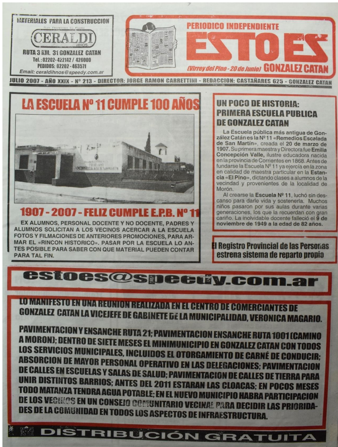
Figura 14. Número 213, julio de 2007.

El centenario de la Escuela 11, decana de las escuelas primarias de gestión pública de González Catán y una de las más antiguas de La Matanza. Anuncio de obras y avance de la descentralización municipal.