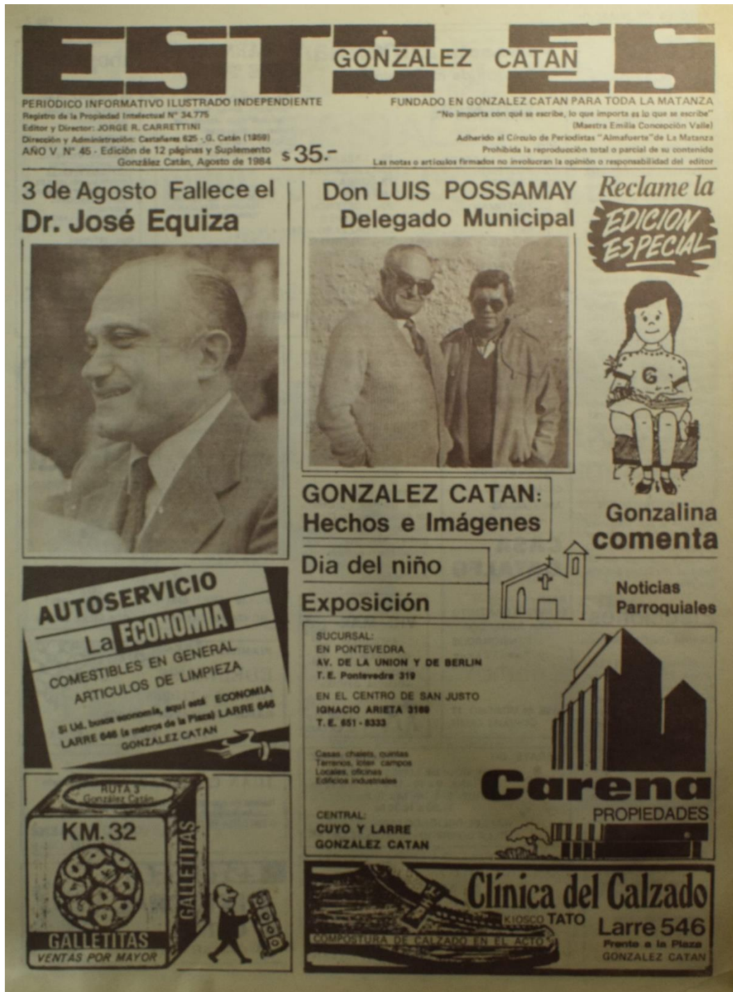
Figura 7. Número 45, agosto de 1984.