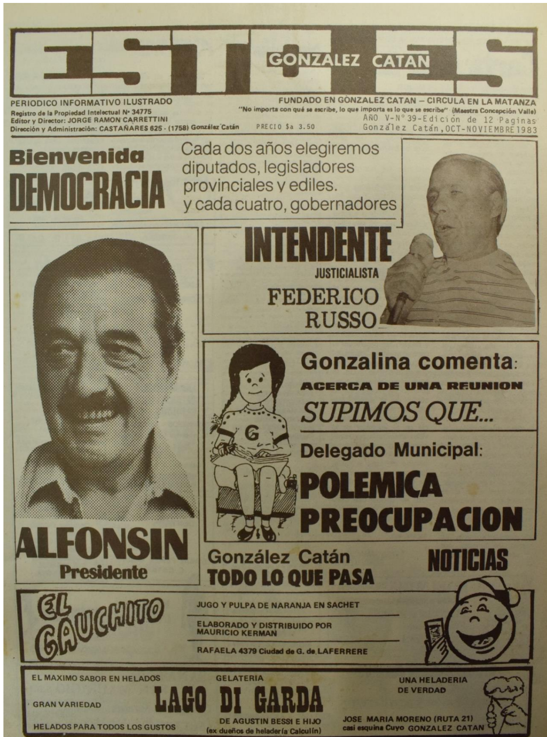
Figura 6. Número 39, octubre-noviembre de 1983.

El carácter local del periódico no impidió registrar los grandes hitos nacionales. "Bienvenida democracia".