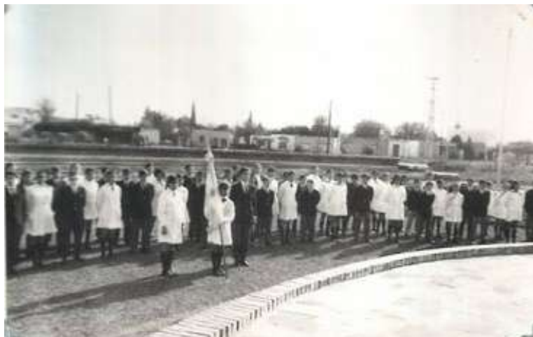
EEM N°1 (1970)