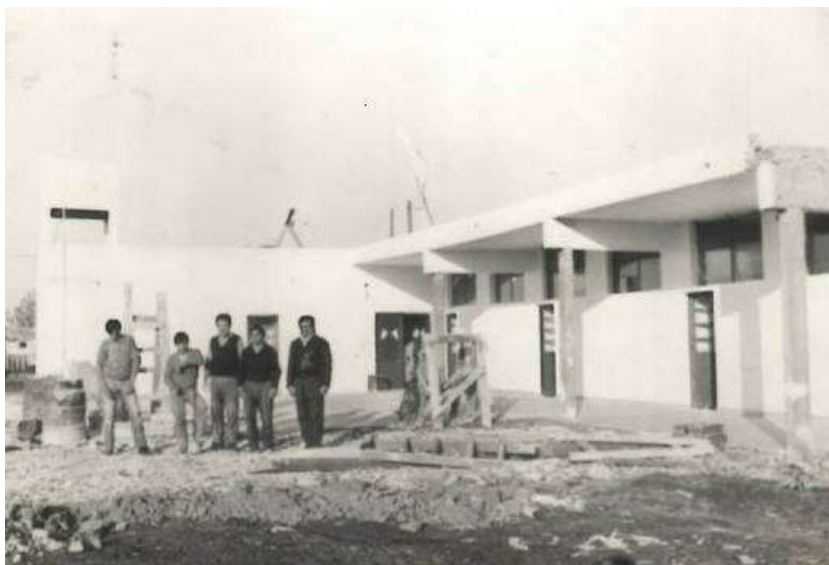
Escuela en construcción

Fue el 12 de diciembre de 1969, justo un año después, cuando en el tan anhelado edificio se llevó a cabo el cierre del ciclo lectivo provincial, con la