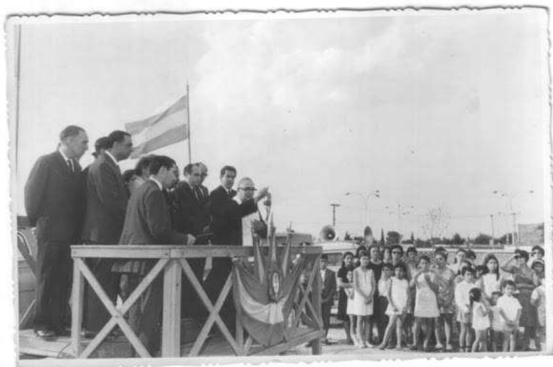
Acto del 12 de Diciembre de 1969

presencia de autoridades civiles y eclesiásticas, Tagliabue, Mons. Carreras, etc., momento en que fueron admiradas las flamantes instalaciones.