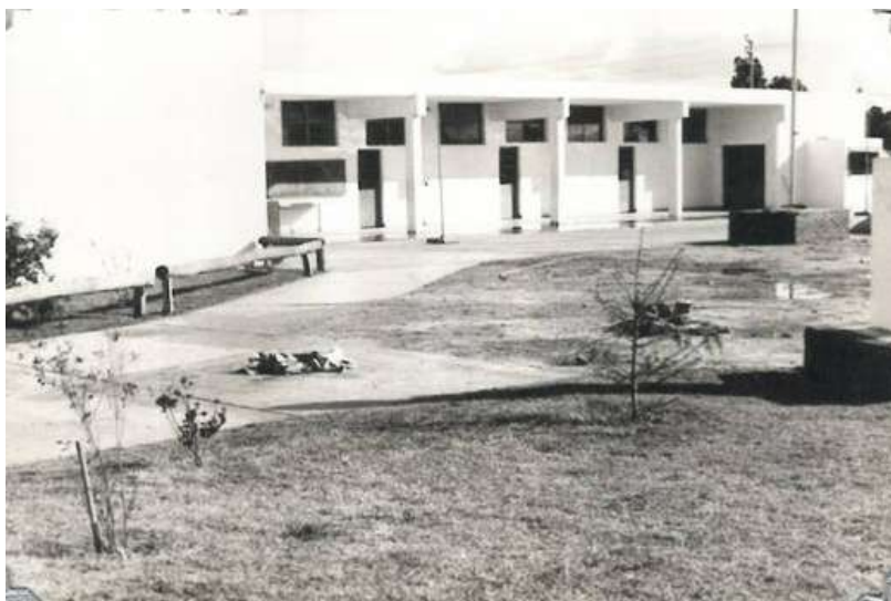
Vista de la escuela en 1969