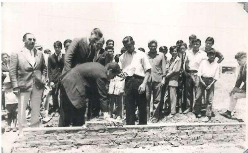
Colocación de ladrillos por autoridades y comunidad