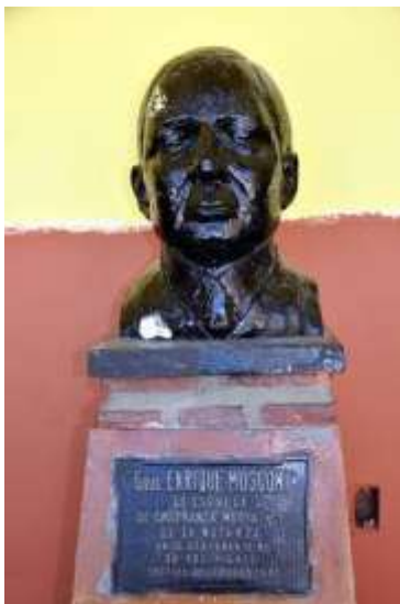
Busto del Gral. Mosconi

En 1975 y dado que se cumplían 35 años de la muerte del Gral. Mosconi, en un acto de homenaje realizado en su honor, se emplazó el busto que esculpó Ilda Carabelli, ex alumna del establecimiento.