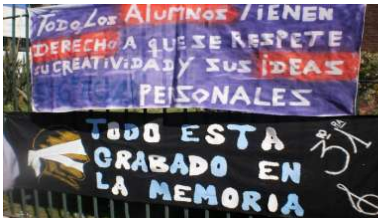
EEM N°1- 2012