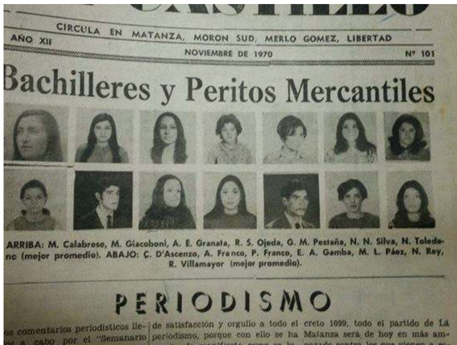
Diario "La Voz de Castillo" publicando los primeros egresados 471

Por supuesto que también existieron hermosos momentos fuera de las aulas que sirvieron para estrechar lazos entre quienes integraban la comunidad educativa. Como ejemplo permítasenos traer dos picnics realizados en 1970 y 1974 por medio de imágenes de la época y en donde puede observarse a una autora de este trabajo cuando era alumna de la institución.