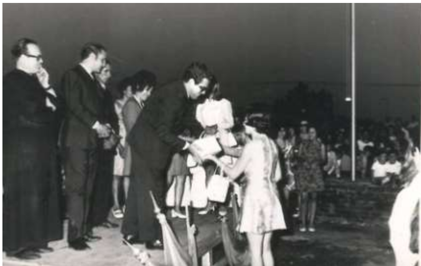
Primera colación (1970)

Por supuesto el diario local, orgullosamente exhibía ese logro en su número de noviembre donde rescataba los rostros de cada flamante egresado.