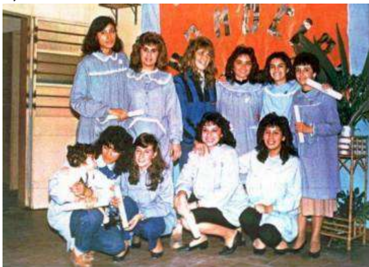
Primeros egresados como Maestros especializados en adultos (1991)