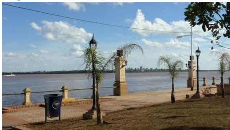
El Ombucito (Corrientes)