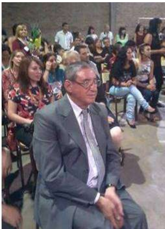
Acto de Entrega de Diplomas