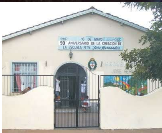
Huerta de la Escuela N°15 (arriba) Escuela N° 15, "José Hernández" (abajo)