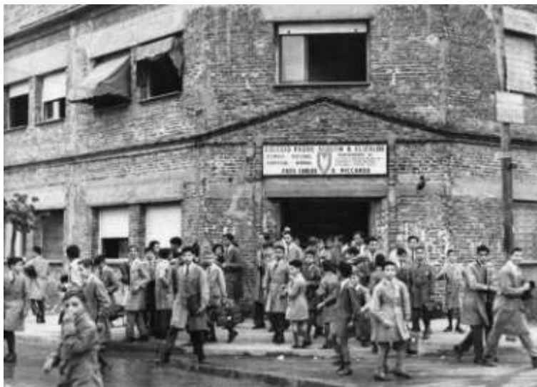
Instituto "Padre Elizalde" (Ciudadela)