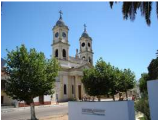
Iglesia de "El Ombucito"

Al concluir sus estudios primarios, comenzó el nivel secundario en La Escuela Normal Regional: "Valentín Virasoro", de Paso de Los Libres, hasta el tercer año, siendo alumno ejemplar.