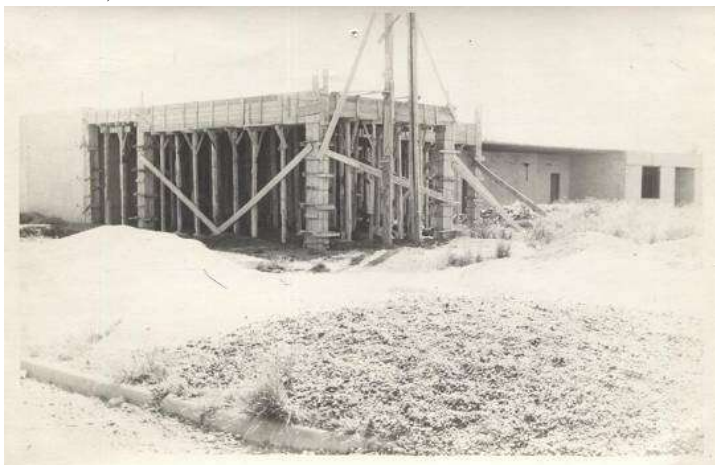
Escuela Media N° 7(1970)

En aquel tiempo de inicio de la construcción, a veces hubo poca gente para trabajar, en otras oportunidades, llegaba lo que él consideraba “una bendición”, de la nada llegaban alumnos, padres, vecinos, docentes, y se sumaban al trabajo.