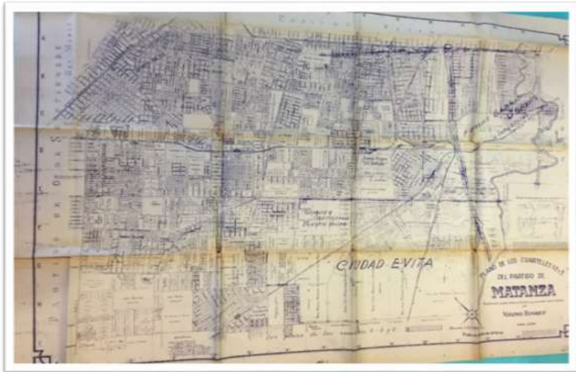
Figura 55. Plano de los cuarteles 1, 2 y 3 del municipio de La Matanza. Fuente: Máximo Randrup. Planos del partido de La Matanza. 1940. Publicación no oficial. Colecciones especiales y archivos. Universidad de San Andrés

*Según el censo nacional de población de 1947, esta localidad incluye: Ramos Mejía, Lomas del Millón, Lomas del Mirador, Tablada, Villa Madero, Villa Luzuriaga