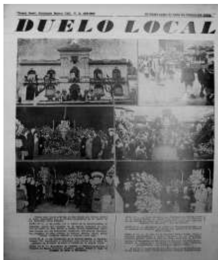
Figura 60. Altares en homenaje a Eva Perón. Fuente: Nueva Idea, 14 de agosto de 1952

La difusión del Plan Económico de 1952 y del Segundo Plan Quinquenal también ocupó parte de la energía del gobierno municipal.